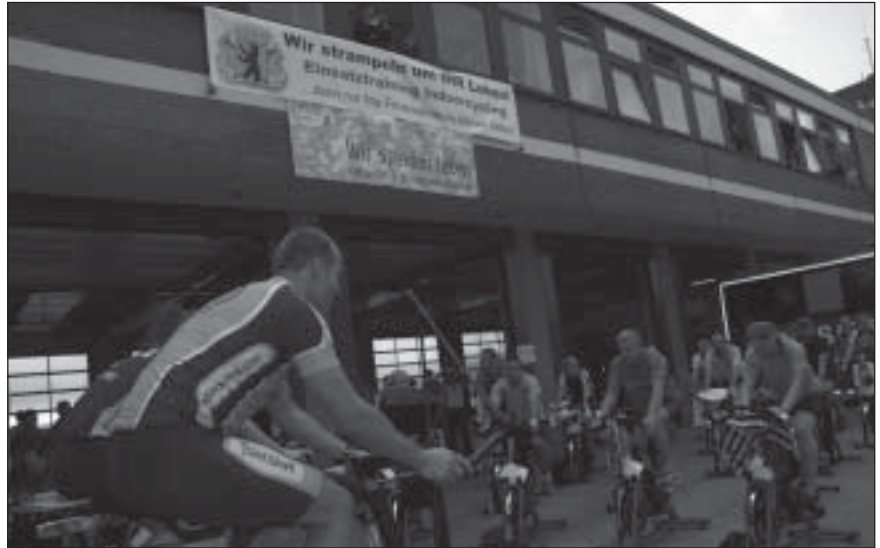
Indoor-Bikes statt Feuerwehrfahrzeuge in der Feuerwache Siemensstadt

Marathons. Und diese wäre mit Sicherheit nicht nur etwas für fitte Feuerwehrleute!